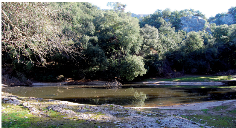
El Pantanet de la coma (Gràcia Salas)

A la bassa hi trobam una important colònia de granots ( Pelophylax perezi ), i si anam amb compte els podem veure sobretot a la primavera i a l'estiu ocupant-ne les voreres. Al més petit senyal de perill, els granots se submergeixen fent un plop característic. El granot és l'amfibi més abundant i està a les Illes Balears, ja que pels seus costums diürns, renouers i gregaris no passen desapercebuts. Són de color verd o terrós, i fins i tot el color pot variar en un mateix individu amb el temps. Tenen la pell llisa i els membres llargs, els quals li faciliten el fet de desplaçar-se a grans bots.