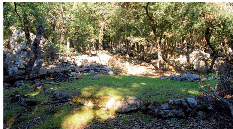
Sitja de carboner i barraca al fons (Gràcia Salas)

Els carboners passen tot l'estiu al bosc: primer per esbrancar o talar els arbres; després, per tragar la llenya cap a la sitja, compondre-la i formar la pila, carbonitzar-la i davallar el carbó obtingut. Per poder viure tant de temps en la solitud del bosc es construeixen una barraca amb brancatge cobert de càrritx. Així passen llargs mesos duent una vida semisalvatge.