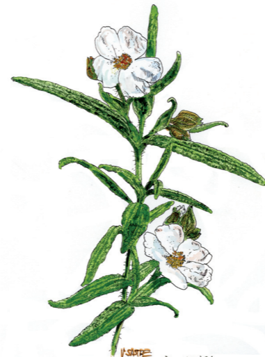
Estepa llimonenca (Vicenç Sastre)