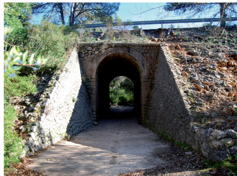
Pont (Gràcia Salas)