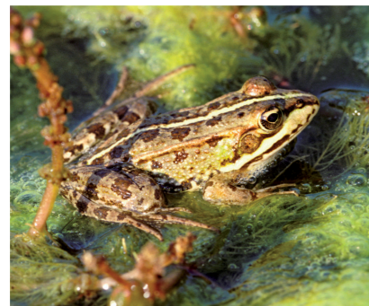
Granot (Sebastià Torrens)