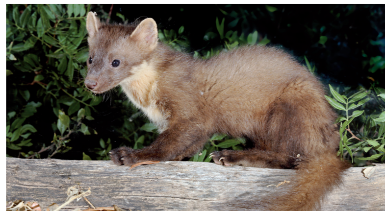
Mart (Sebastià Torrens)

Per aquests indrets, encara que sigui difícil, si no feim gaire renou podem veure alguns dels mamífers carnívors de la zona: el mostel ( Mustela nivalis ) o el mart ( Martes martes ). Ambdós mustèlids tenen un cos allargat amb pèl curt i coloració variable, segons l'espècie. El mostel habita sobretot en zones agrícoles com oliverars amb presència de marges o caramulls de pedres, on fa les seves llogueres. En canvi, el mart és una espècie més pròpia de les zones muntanyoses, tot i que en els darrers anys està patint una forta expansió cap a l'interior i sud de l'illa. En ocasions, malgrat que no els puguem observar, en podem constatar la presència a partir dels seus excrements, que solen deixar als camins per on passam. Els col·loquen estratègicament, de manera que si uníssim tots els punts on s'ubiquen es delimitarien els territoris dels mascles dominants i, mitjançant els senyals olfactius que desprenen, es comunicaria a la resta de membres de l'espècie que aquell territori ja està ocupat.