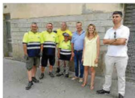
Los miembros del SAM con las nuevas incorporaciones.

Se enlaza con la campaña No alimentis al monstre coordinada por la red de aguas públicas de Mallorca que lucha contra esto. Consistirá en identificar los residuos en las conexiones