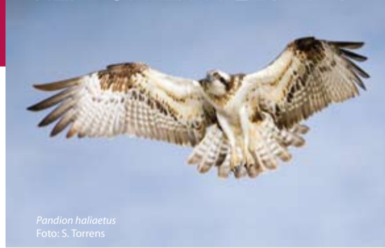
Pandion haliaetus

Com altres zones humides del Mediterrani, s'Albufereta és un enclavament d'importància vital per a les aus aquàtiques durant les migracions anuals. Així mateix, durant les rigoroses sequeres estivals pròpies del clima mediterrani les zones humides com s'Albufereta es converteixen en autèntics oasis per a moltes aus.