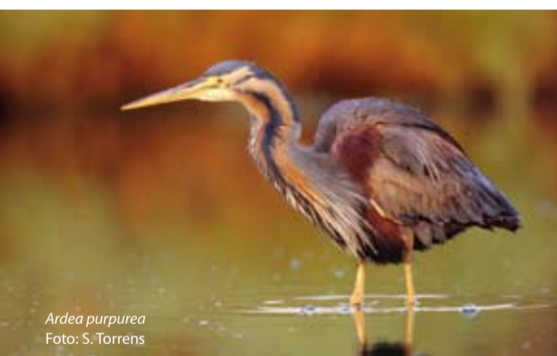
Ardea purpurea

La zona humida litoral de s'Albufereta constitueix una de les joies de la badia de Pollença tant pel seu paisatge especial com pels valors ornitològics i botànics que conté. La Reserva natural protegeix una superfície de 211 hectàrees i al seu voltant les 290 hectàrees de la seva perifèria de protecció tenen regulades algunes activitats i usos per evitar-hi impactes indesitjats.