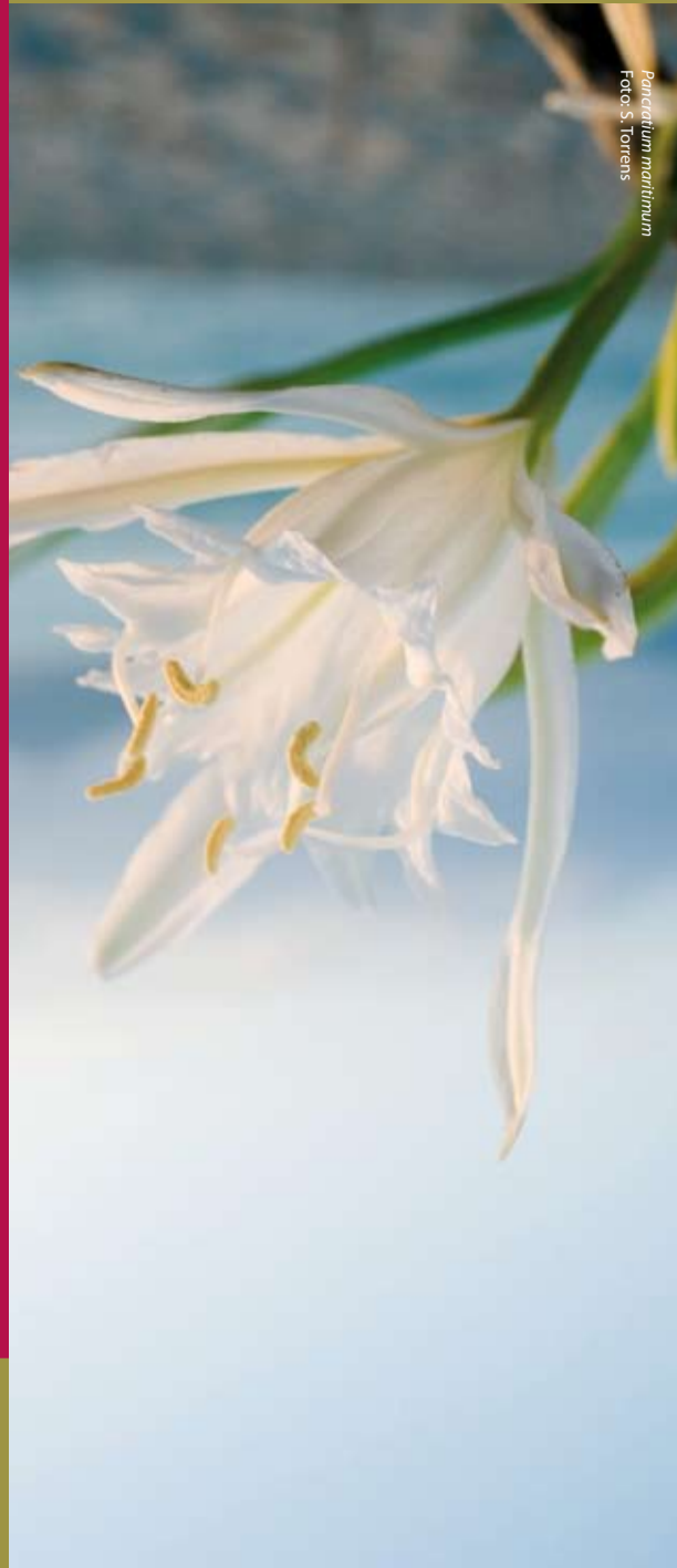
Pancratium maritimum

Reserva natural de s'Albufereta Llista de Correus E-07458 Can Picafort 07458 · Mallorca Tel. 971 89 22 50 · Fax 971 89 21 58 reserva.albufereta@gmail.com