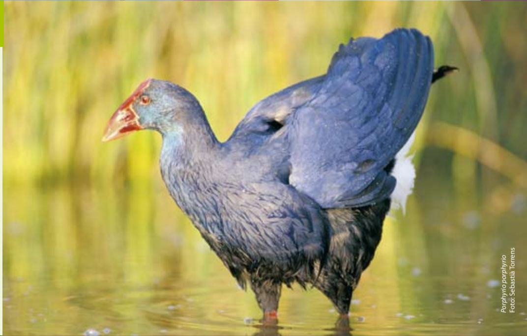
Porphyrio porphyrio

Teile des Graslands stammen zwar noch aus dem Tertiär, das heutige Feuchtgebiet entstand jedoch vor weniger als 100.000 Jahren. Die ans Meer grenzenden Dünen sind jüngeren Datums und etwa 10.000 Jahre alt.