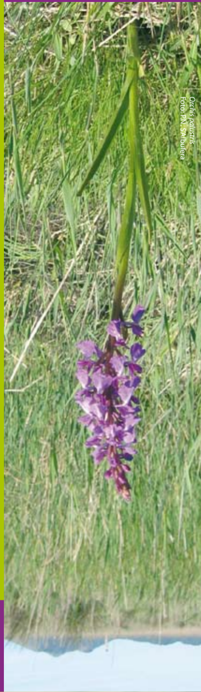
Orchis poduensis Foto: FN, S'Albufera