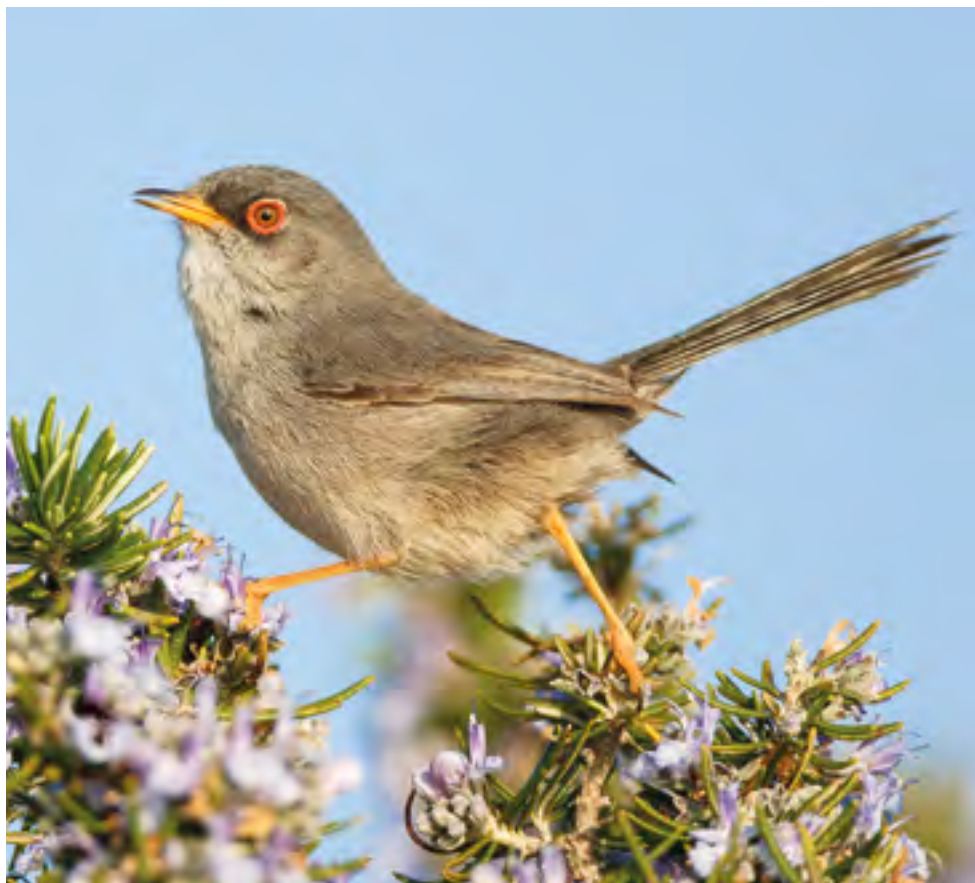
Busqueret de coa llarga ( Sylvia balearica )

En sortir del petit pinar, trobarem l'antic celler, que actualment acull el museu etnogràfic. Abans d'entrar-hi, al coster oposat, podem veure una casa d'un aiguavés, construïda a final del segle XIX i restaurada el decenni de 1990, que formava part del conjunt agrícola de l'illa, juntament amb el celler i els sementers de la zona. Ben davant hi ha un hort que es regava aprofitant una mina d'aigua dolça. Completen el conjunt els fassers de les marjades.