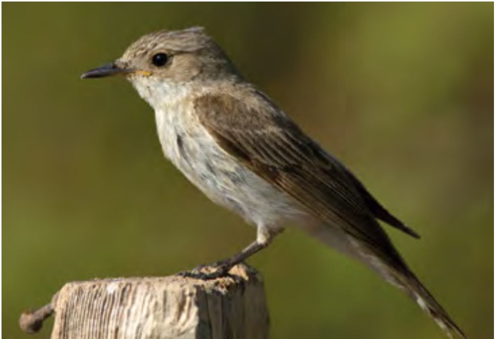
Papamosques o caçamosques ( Muscicapa tyrrenica )

Recomanacions: Abans de començar, us recomanem passar per l'oficina d'informació del port, ja que l'entrada al museu està subjecta a l'horari d'obertura, que varia al llarg de l'any.