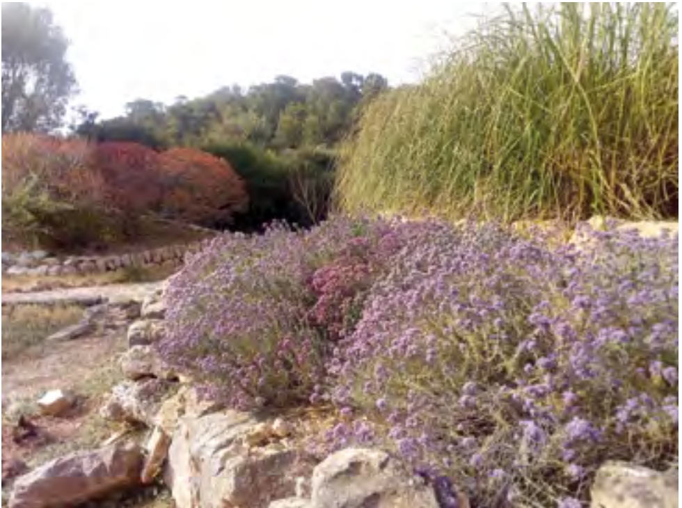
Jardí botànic

Just devora l'edifici del celler, hi trobarem el jardí botànic, on podrem veure la vegetació més singular i característica del Parc Nacional, a vegades difícil d'observar en el seu hàbitat natural, ja sigui per la localització inaccessible o perquè es troba en una zona de reserva. L'alfals arbori ( Medicago citrina ), la motxa o ugó ( Ononis crispa ), la palònia ( Paeonia cambessedesii ) o la rotgeta ( Rubia caespitosa ), endemisme cabrerenc, són joies botàniques que conviuen a Cabrera amb d'altres espècies més conegudes, com els pins ( Pinus halepensis ), les malves ( Lavatera arborea ) o el romaní ( Rosmarinus officinalis ).