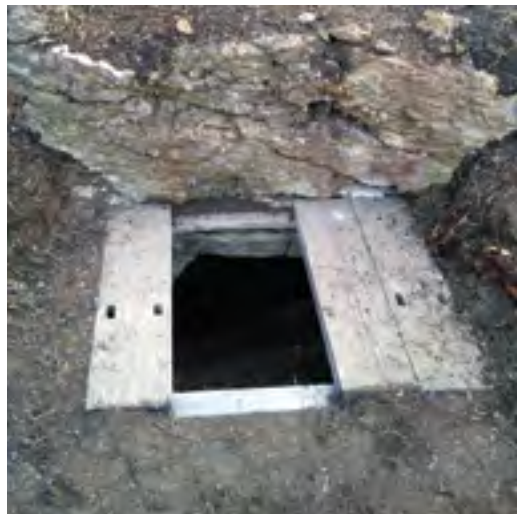
Secret de contraban

Excavat a la roca hi trobarem un secret, un amagatall on en temps de crisi i, especialment, durant la postguerra s'hi custodiaven productes de contraban, com cafè, sucre, tabac o alcohol, abans de ser transportats cap a Mallorca.