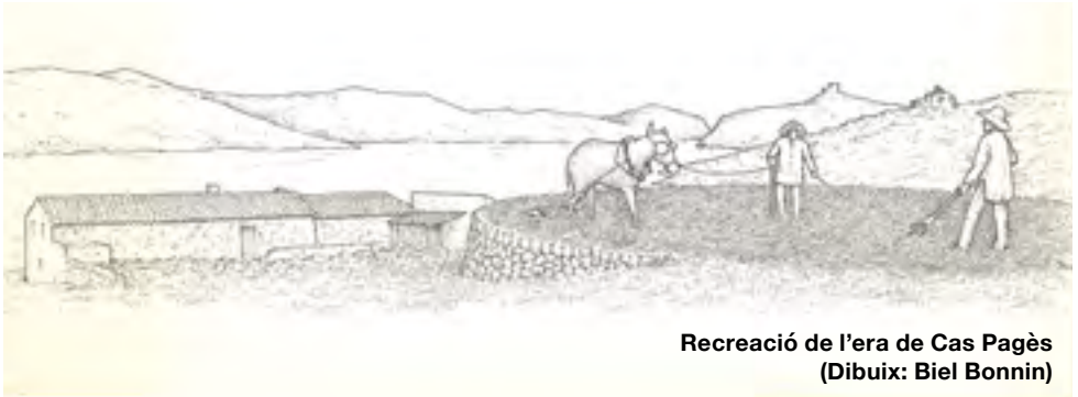
Recreació de l'era de Cas Pagès (Dibuix: Biel Bonnin)

Seguint el camí que voreja els antics sementers cap a l'interior de la vall, un caminet senyalitzat ens menarà dins el pinar, en expansió d'ençà que es va posar fi a l'aprofitament forestal i la ramaderia. En una clariana hi trobarem una era de batre, testimoni del passat agrícola de l'illa. Aquí, una vegada segats els cereals, una bístia feia rodar en cercle un carretó de batre, com el que podem observar al museu, per separar el gra de la palla.