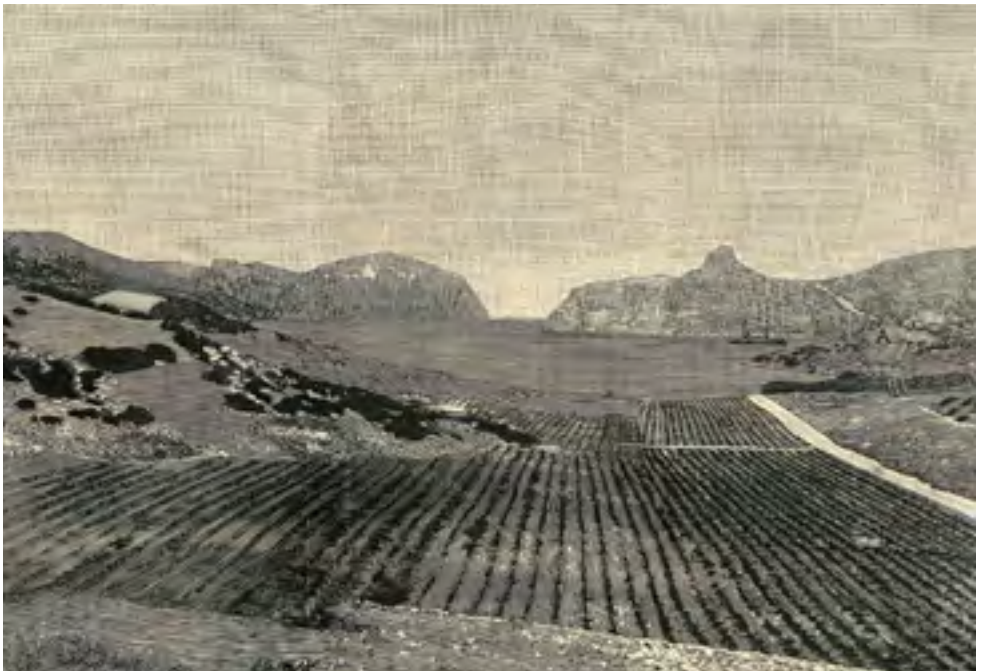
El Pla de ses Figueres sembrat de vinya, segons un gravat publicat l'any 1892 a La Ilustración Española y Americana

Sortint del port, hem de seguir la pista que voreja la badia i que mena a sa Platgeta. Una vegada allà, ens endinsarem cap a l'interior de l'illa, passant per una zona sense la garriga original. Són els antics camps de conreu de secà, utilitzats fins ben entrat el decenni de 1960. Actualment i per l'abandonament dels usos agrícoles, l'àrea està ocupada predominantment per plantes herbàcies i un bosquet de savines ( Juniperus phoenicea ) que creix al bell mig de la vall. Algunes figueres ( Ficus carica ) prop del camí ens recorden el passat agrícola de l'illa. En aquest lloc abunden petits ocells que cerquen aliment. Tot l'any hi veurem caçamosques ( Muscicapa tyrrhenica ), passarells ( Linaria cannabina ) i verderols ( Chloris chloris ). Altres, com els tords ( Turdus philomelos ), els ropits ( Erithacus rubecula ) i els coa-roges ( Phoenicurus sp. ), només els podrem observar a l'hivern.