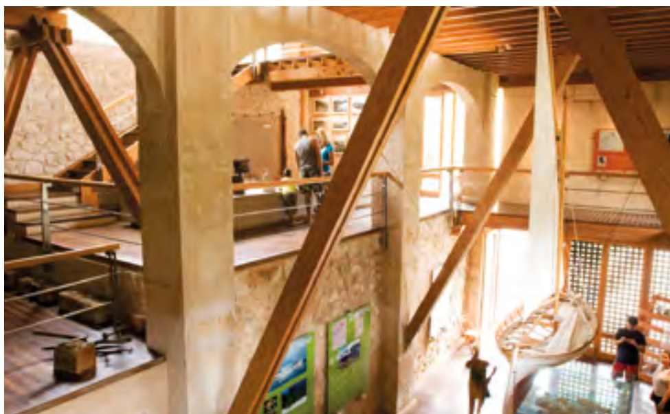
Interior del museu

Entrant per la planta superior, viatjarem per la història de l'arxipèlag a través de les restes trobades, tant a terra com a la mar, des de la prehistòria i l'època antiga fins al segle XX. Hi podem observar àmfores d'època púnica i romana, ceràmica de diferents períodes, una maqueta del castell, una representació de materials recopilats de l'època dels presoners francesos, etc. No podem deixar aquesta planta sense contemplar la panoràmica sobre el port pel finestral.