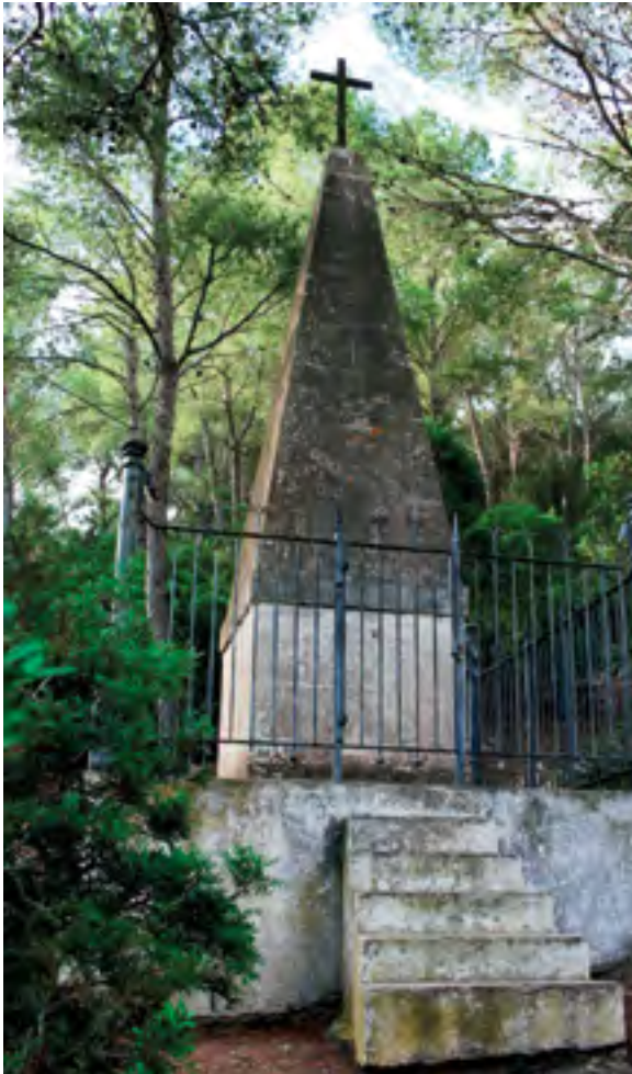
Monument als presoners napoleònics

en condicions precàries i s'hagueren d'imposar una certa organització per a la construcció de les barraques, el proveïment de l'aigua i el repartiment dels queviures, ja que l'aliment arribava molt irregularment en vaixells. Atenuaren els efectes del captiveri amb representacions d'obres de teatre, la manufactura d'objectes de fusta de savina o boix, que canviaven per menjar als pescadors que s'acostaven des de Mallorca. L'empresonament dels soldats francesos acabà després de cinc llargs anys, i només prop de 3.600 sobrevisqueren i tornaren a les seves llars.