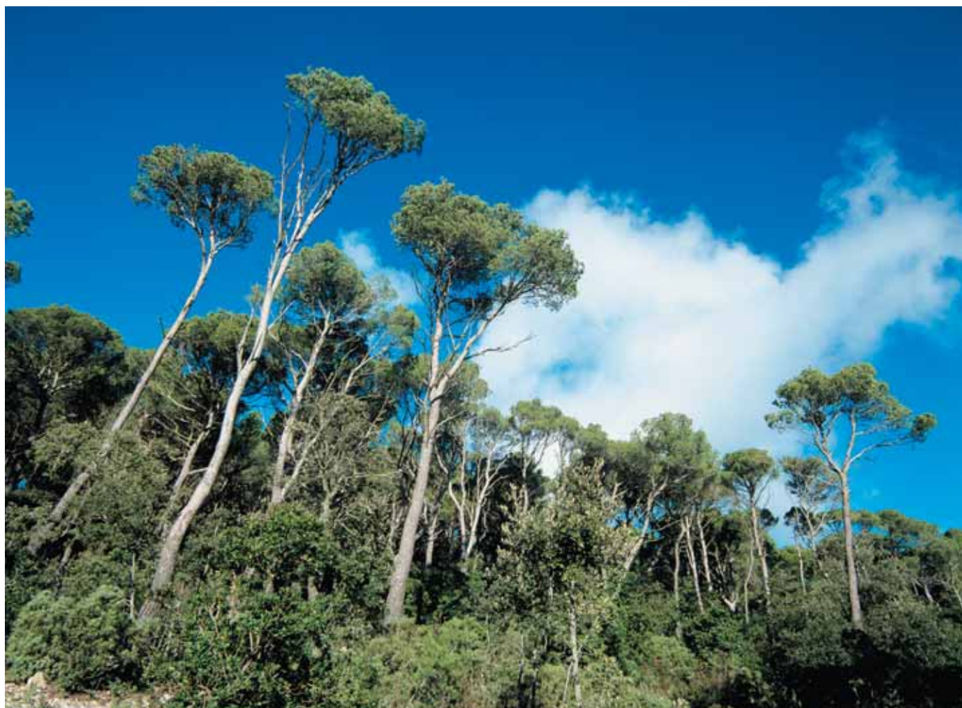
Pujada al penyal d'Honor

Baixam pel mateix camí fins a la pista forestal i de nou cap a la barrera de fusta. Ara tenim tres opcions. La primera, tornar a Bunyola desfent les nostres passes cap al camí des Grau; la segona, baixar per la carretera de la comuna, i la tercera és anar cap a l'esquerra i arribar fins a l'àrea recreativa de Cas Garriguer.