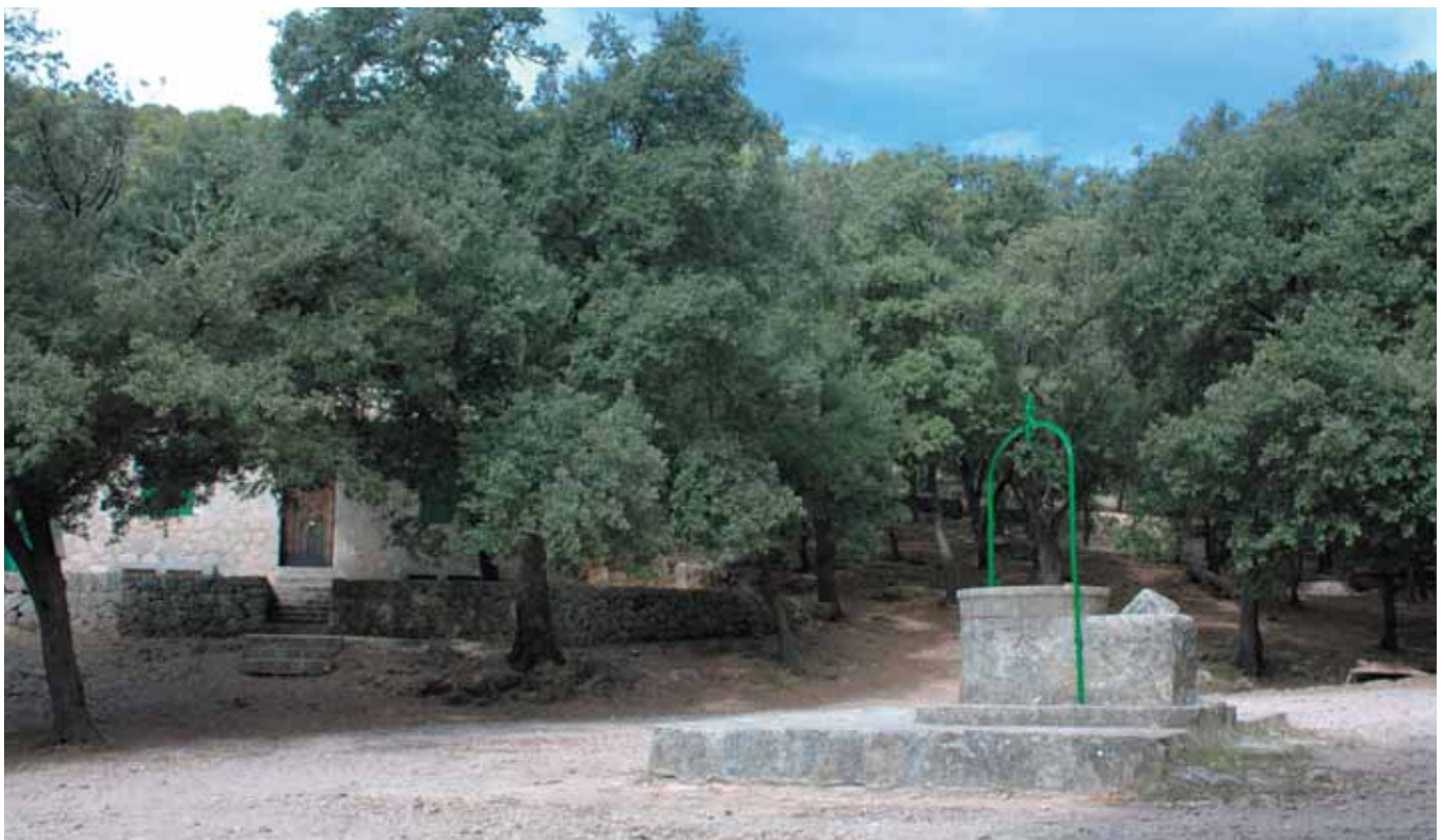
Cas Garriguer