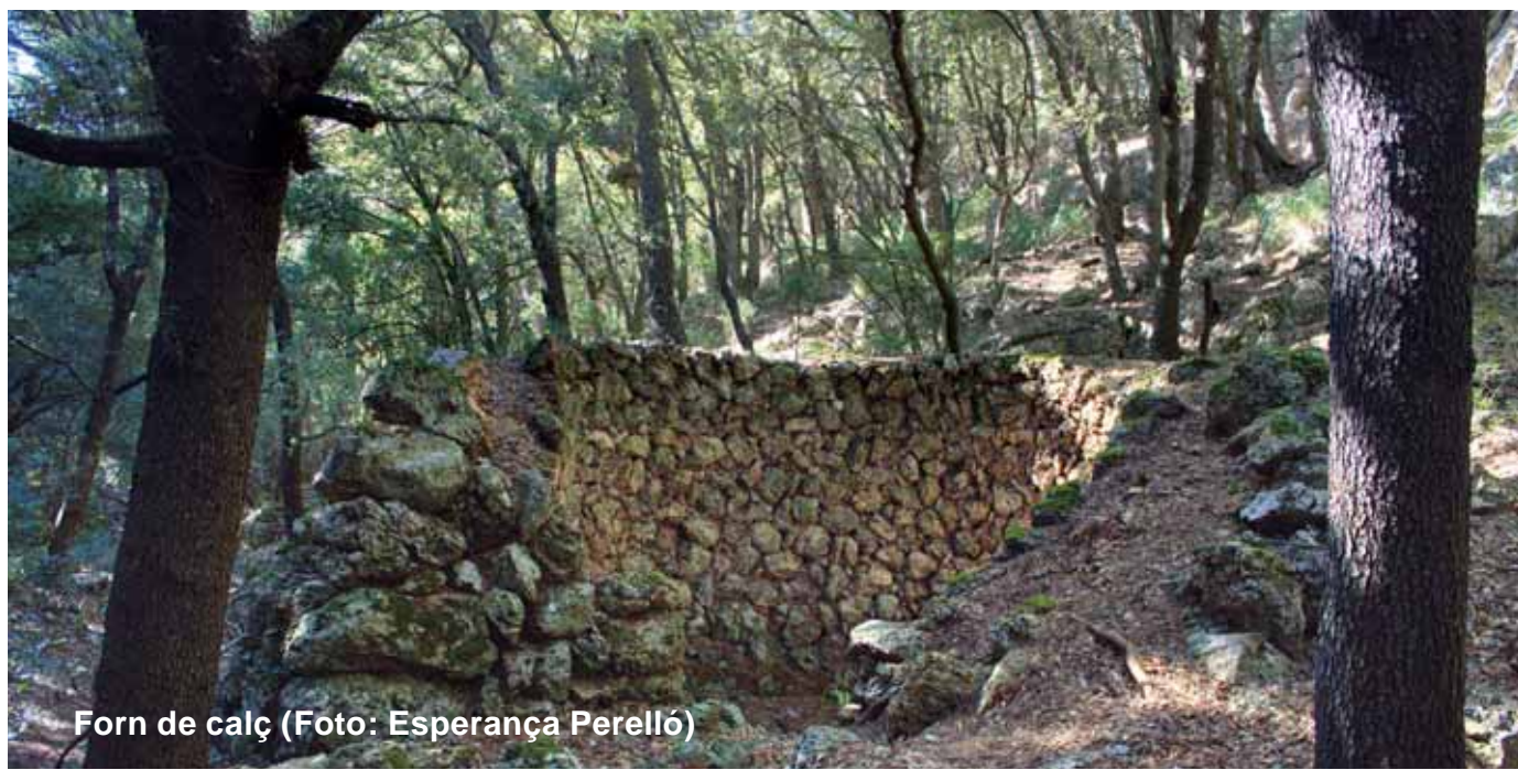
Forn de calç

A la comuna de Bunyola, fins a mitjans del segle XX s'hi feien diversos aprofitaments forestals: tala de pins, feixos de llenya prima, forns de calç i sitges de carbó. L'ajuntament subhastava anualment l'explotació forestal, la caça i les pastures, i amb els beneficis obtinguts es finançaven obres públiques. Als anys cinquanta començaren a minvar aquests aprofitaments i avui en dia només es realitzen algunes talses de pins. Actualment, la comuna de Bunyola té una funció de conservació i oci.