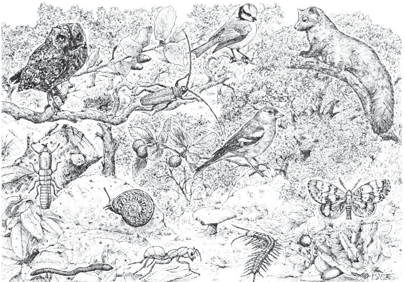
Components de la xarxa tròfica de l'alzinar (Dibuix: Vicenç Sastre)

Alhora, aquests insectes serveixen d'aliment a ocells com el ferrerico blau ( Cyanistes caeruleus ), el cap-ferrerico ( Parus major ) o el papamosques ( Muscicapa striata ), que tot i que no és exclusiu dels alzinars, sovint l'hi veurem, caçant al vol. En determinades èpoques es poden veure falcons marins ( Falco eleonora ) sobrevolar els alzinars a la recerca de banyarriquers.