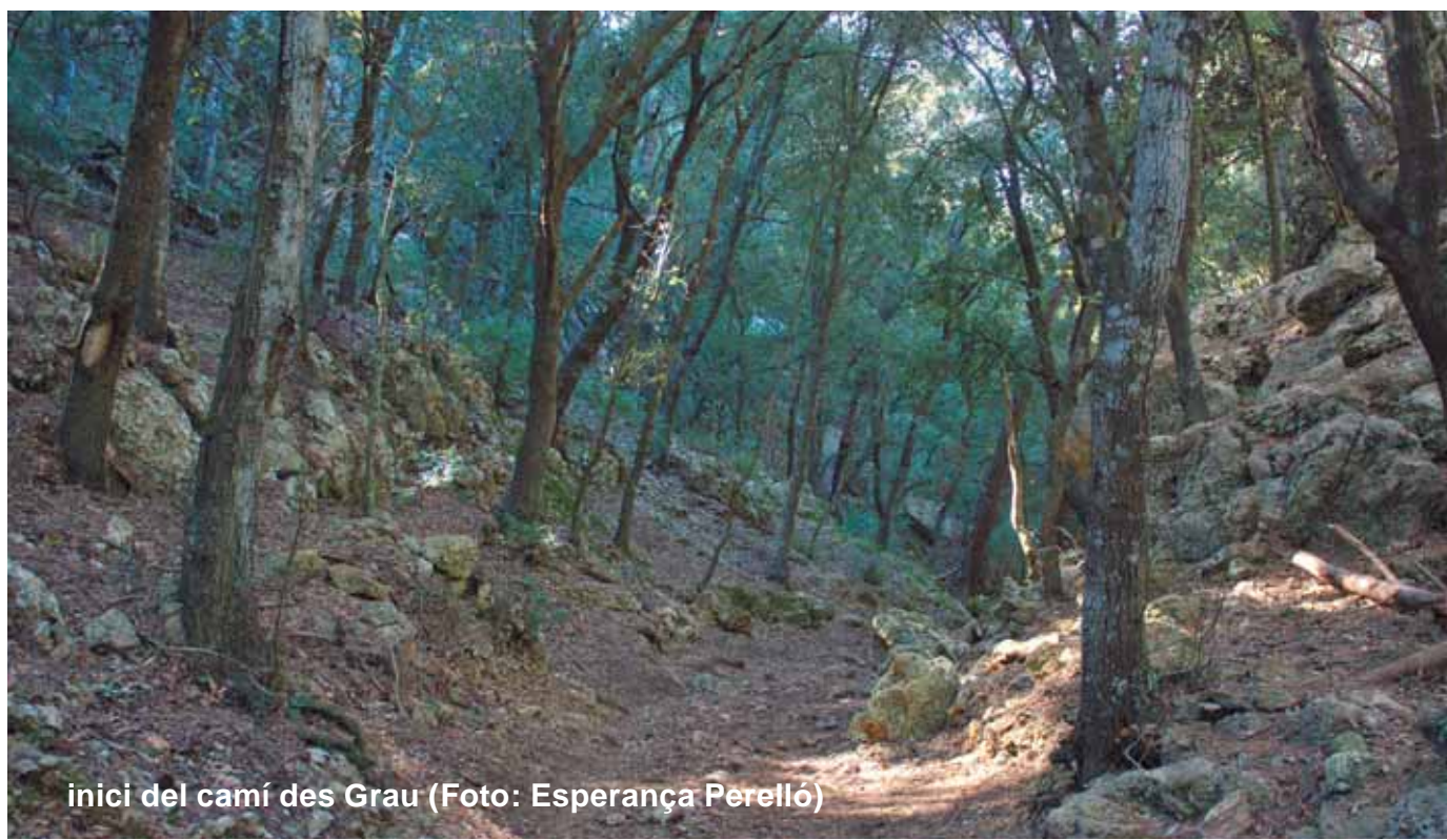
inici del camí des Grau

Els arbres i la resta de plantes són els productors primaris d'aquest ecosistema i proporcionen aliment a herbívors i a descomponedors de la matèria orgànica. Així, podem trobar insectes fitòfags com l'eruga peluda de l'alzina ( Lymantria dispar ) que s'alimenta de les fulles de les alzines; la papallona de l'arbocera ( Charaxes jasius ), que s'alimenta dels fruits madurs; també hi és present el banyarriquer ( Cerambyx cerdo ), i altres descomponedors com els tèrmits o formigues blanques ( Reticulitermes lucifugus ), que viuen a l'interior de la fusta morta, que van digerint amb l'ajut dels bacteris presents al seu intestí.