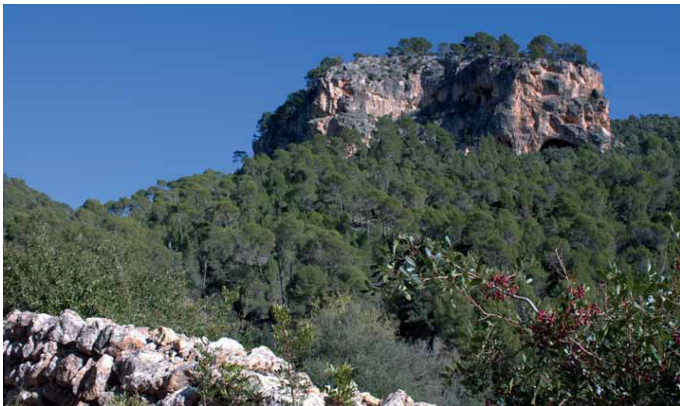
Penyal de Can Fil