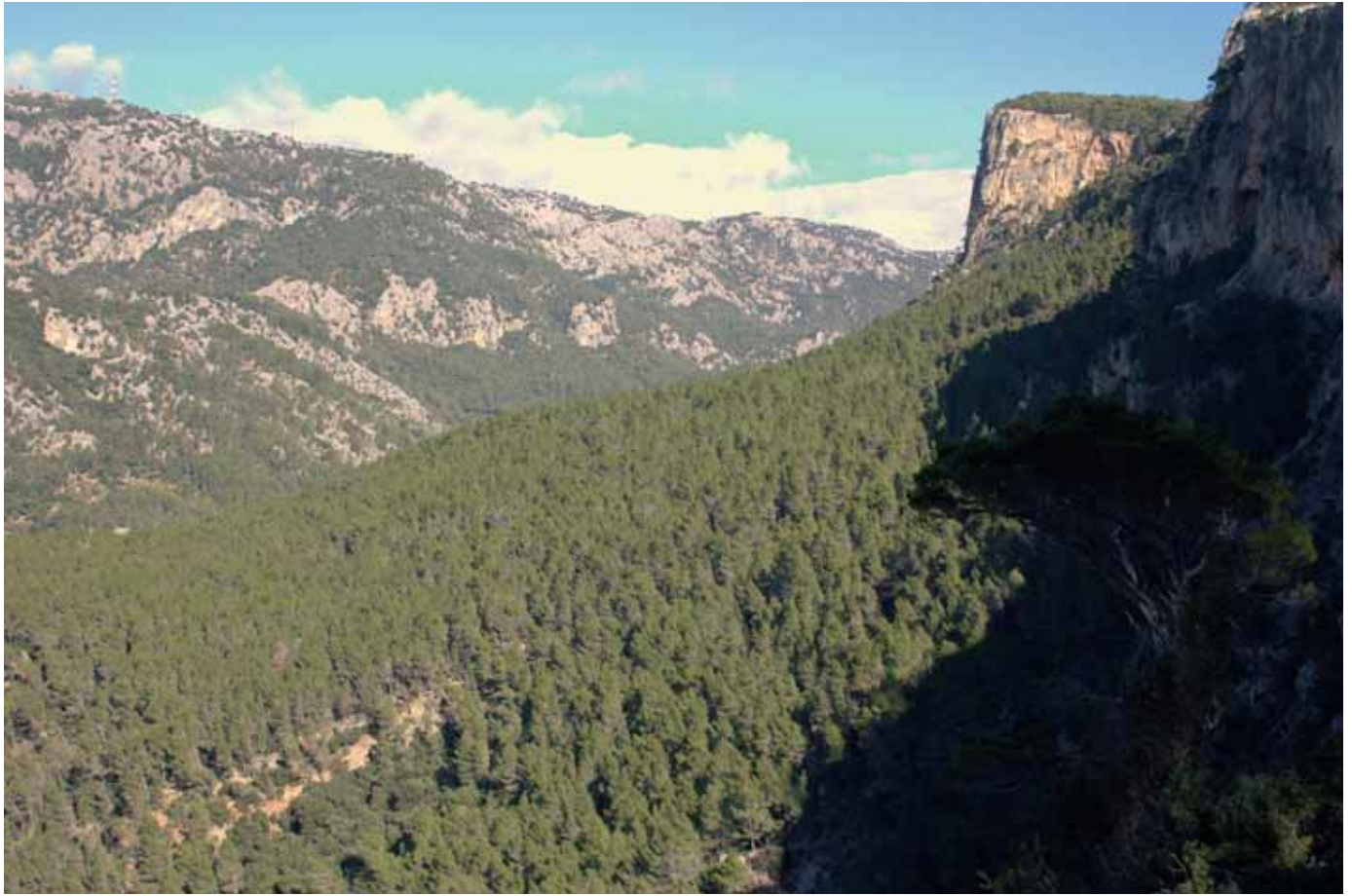
Vista des del mirador de sa Màquina Vella

Després del forn de calç, el camí és més estret i costerut i descriu ziga-zagues contínues per salvar els desnivells com si es tractàs d'una escala, d'aquí ve el nom des Grau.