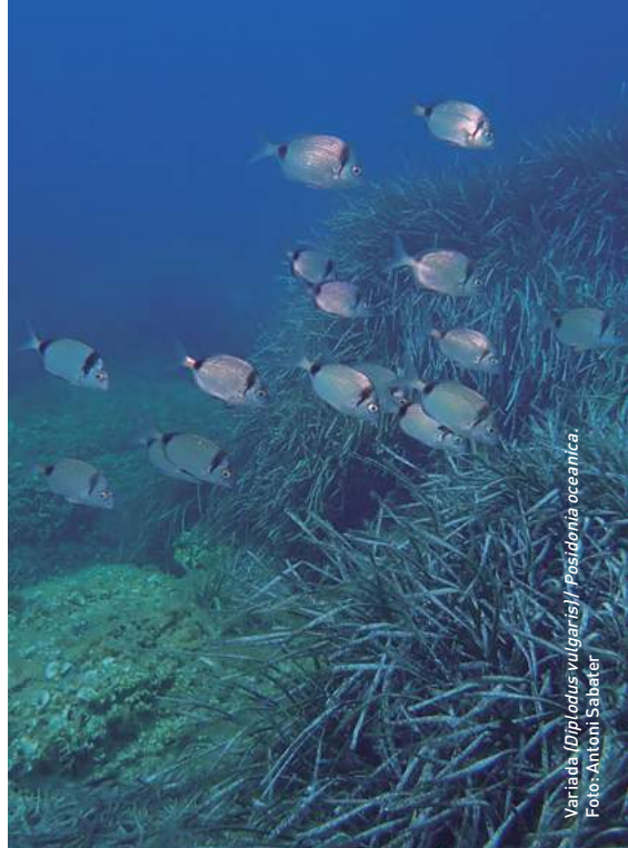
Varieta ( Diplodus vulgaris ) / Posidonia oceanica .

El primer grau de protecció que va rebre aquest lloc fou el resultat d'una intensa mobilització social, que al crit de «Salvem es Trenc» va arribar fins al Parlament i el va declarar Àrea Natural d'Especial Interès, que li atorgava una protecció urbanística. Atès el seu interès ornitològic elevat, aquest espai ha estat considerat com a Àrea d'Especial Importància per a les Aus per la Societat Espanyola d'Ornitologia. L'any 2006 es va integrar entre els llocs d'interès comunitari (LIC) i les zones d'especial protecció per a les aus (ZEPA). Després de l'aprovació del Pla de gestió, l'any 2015 es converteix en zona d'especial conservació (ZEC) i amb la Llei 2/2017, de 27 de juny, es declara el Parc Natural Marítimoterrestre Es Trenc-Salobrar de Campos