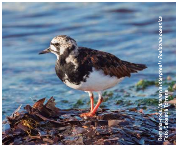
Remene-rocs ( Acteria interpres ) / Posidonia oceanica

Aquests búnquers son testimoni del procés d'erosió i retrocés que sofreix la platja des de fa més de 40 anys. El col·lectiu artístic Boa Mistura els va transformar l'ArtNit de Campos de l'any 2014 pintant-los de blanc i escrivint-hi versos del poema "Cala Gentil" del poeta mallorquí Miquel Costa i Llobera.