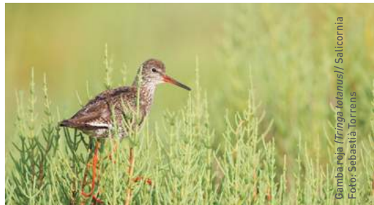
Gamba roja ( Tringa laganus ) / Salicornia

Respecte a la fauna, els passos migratoris d'aus tenen una extraordinària importància tant a la primavera com a la tardor. A la garriga trobam rata-pinyades, llebres ( Lepus granatensis ), conills ( Oryctolagus cuniculus ), eriçons ( Atelerix algirus ), la serp de garriga ( Macropododon cucullatus ), nombrosos invertebrats a la zona de la platja i el sistema dunar i una gran diversitat d'espècies en l'àmbit marí.