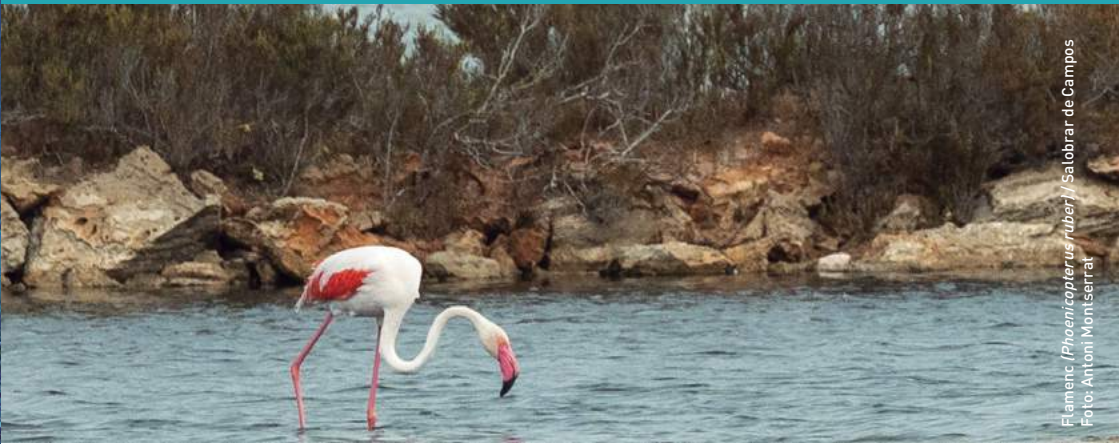
Flamenc ( Phoenicopterus ruber ) / Salobrar de Campos

En el sistema platja-duna des Trenc-Salobrar de Campos, hi coexisteixen un nombre significatiu d'hàbitats d'interès comunitari, amb importants praderies de posidònia, extenses platges d'arenes fines formades a partir d'esquelets d'organismes marins, cordons de dunes primàries davanteres amb borró ( Ammophila arenaria ), dunes estabilitzades amb Crucianella maritima , zones humides de magnituds importants, com es Salobrar de Campos i basses litorals, com també boscs de pi ( Pinus halepensis ) i savina ( Juniperus phoenicea ), que fixen el sistema dunar més consolidat. Aquesta varietat d'hàbitats, limítrofs amb cultius de secà i zones de guaret i pastures, donen lloc a la presència d'una biodiversitat elevada. A la vegetació terrestre, a més dels pinars mediterranis i els savinars costers, destaquen els salicornars i la vegetació halòfila. Dins el grup de les espècies protegides pel Catàleg Balear, hi trobam el gatell ( Launaea cervicornis ), Limonium antoni-llorensii , lliris de mar ( Pancratium maritimum ) i tamarells ( Tamarix canariensis ); i destaca per la seva singularitat la presència de dos endemismes vegetals: Diplotaxis ibicensis i Helianthemum caput-felis .