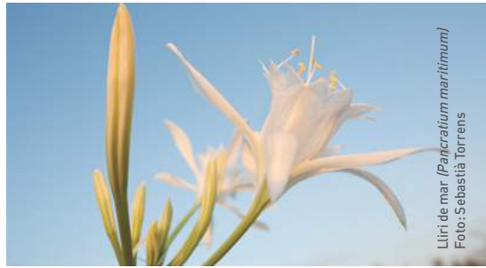
Lliri de mar ( Pancratium maritimum )

En el sistema platja-duna des Trenc-Salobrar de Campos, hi coexisteixen un nombre significatiu d'hàbitats d'interès comunitari, amb importants praderies de posidònia, extenses platges d'arenes fines formades a partir d'esquelets d'organismes marins, cordons de dunes primàries davanteres amb borró ( Ammophila arenaria ), dunes estabilitzades amb Crucianella maritima , zones humides de magnituds importants, com es Salobrar de Campos i basses litorals, com també boscs de pi ( Pinus halepensis ) i savina ( Juniperus phoenicea ), que fixen el sistema dunar més consolidat. Aquesta varietat d'hàbitats, limítrofs amb cultius de secà i zones de guaret i pastures, donen lloc a la presència d'una biodiversitat elevada. A la vegetació terrestre, a més dels pinars mediterranis i els savinars costers, destaquen els salicornars i la vegetació halòfila. Dins el grup de les espècies protegides pel Catàleg Balear, hi trobam el gatell ( Launaea cervicornis ), Limonium antoni-llorensii , lliris de mar ( Pancratium maritimum ) i tamarells ( Tamarix canariensis ); i destaca per la seva singularitat la presència de dos endemismes vegetals: Diplotaxis ibicensis i Helianthemum caput-felis .