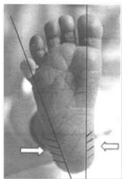
Punció en taló amb llanceta