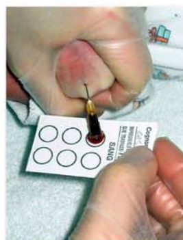
Punció en ma amb agulla 25-G