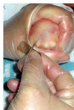
Punció en ma amb palometa 27-G