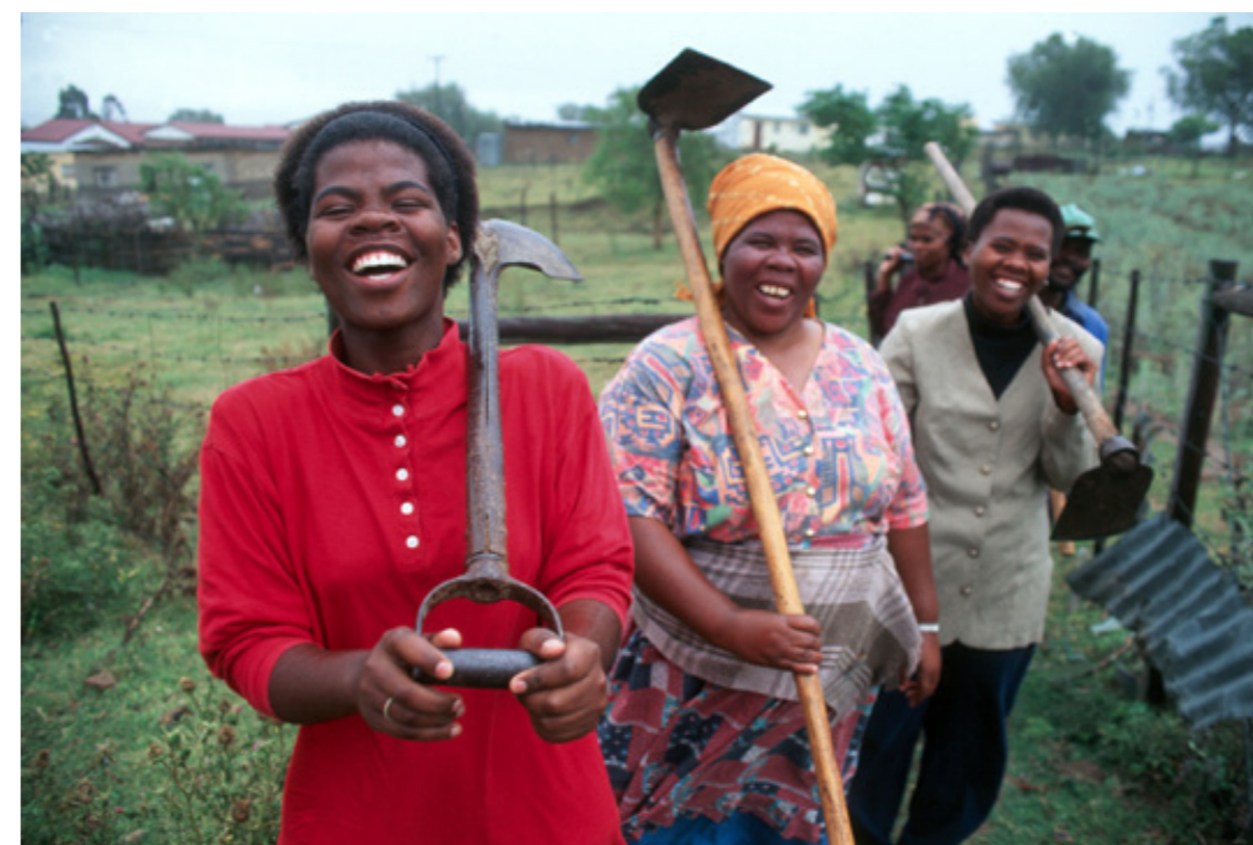
Les grans explotacions destrueixen l'ocupació i el medi de vida del petit camperol.