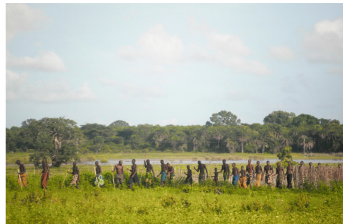
La demanda de terres està derivant en la pèrdua de terres de pastura i de boscos.

Segons ha informat GRAIN, Ngozi Okonjo-Iweala, director administratiu del Banc Mundial, reconeixia la terbolesa d'aquests projectes en manifestar que "el vel de misteri que sovint envolta a aquests acords comercials de terra s'ha d'aixecar perquè la gent pobre no hagi de pagar l'enorme preu de perdre la seva terra" 45 .