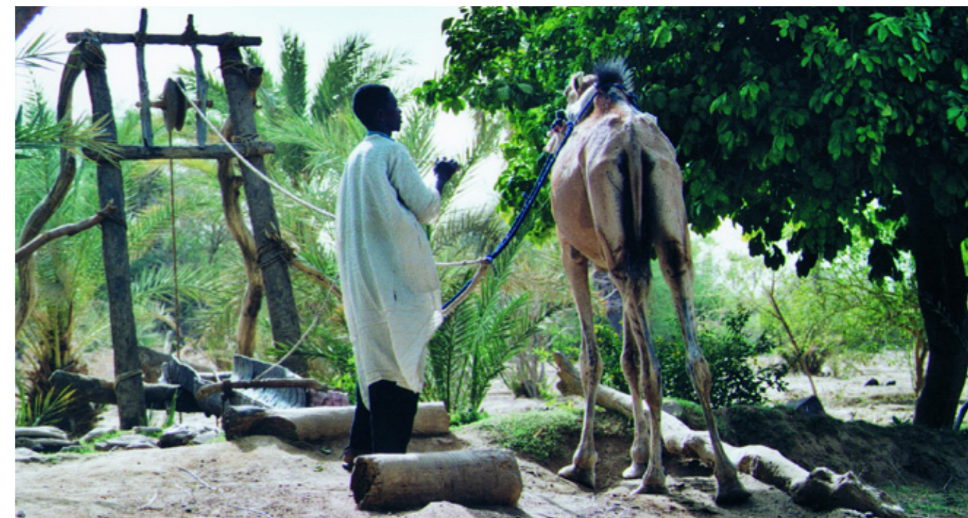
Les zones més humides, en èpoques de sequera, serveixen de refugi per als pastors.

Segons l'Observatori del Dret a l'Alimentació i la Nutrició, un acord secret entre Kenya i Qatar preveu un intercanvi de 40.000 hectàrees (moltes d'elles del delta del riu Tana) per 2.500 milions de dòlars que finançaran un port enfocat a l'exportació, ja que Qatar desitja sembrar fruites i verdures a Kenya. Un altre projecte, suposadament desenvolupat per l'empresa local Mumia Sugar Company, preveu que 20.000 hectàrees es destinin al cultiu de canya de sucre per etanol 52 . Aquest cas va ser àmpliament repudiat per les comunitats locals i es va dur a la Cort Suprema, que va emetre una sentència a favor de l'empresa el 2009; tot i que a causa de la recent fam, el govern ha proporcionat 40.000 hectàrees a la institució pública que gestiona el riu Tana per al cultiu d'aliments. Tot i això, s'ha informat que molts residents locals van ser expulsats de les seves terres 53 .