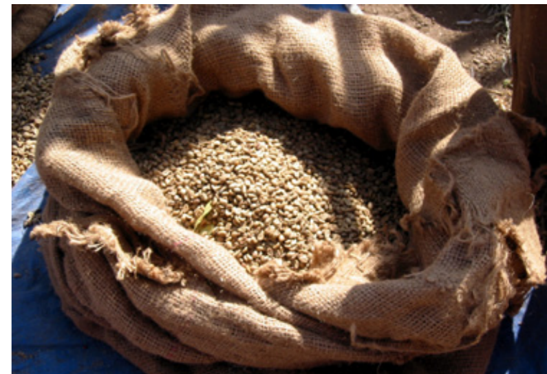
Aquest "mercadeig" ha expulsat ja a milers de famílies de les seves terres i posa en perill la seva sobirania alimentària. Foto: Martínez Alonso (Etiòpia)

Més xocant encara és comparar aquest trencaclosques amb un altre comunicat de la FAO emès al juny, en el qual valorava un projecte propi d'horticultura urbana desenvolupat en diverses ciutats de la República Democràtica del Congo. Amb un pressupost de 10 milions de dòlars s'havia aconseguit augmentar la producció d'aliments bàsics per al consum i la venda en mercats locals. Això havia repercutit en una millora dels ingressos i de la seguretat alimentària local 23 . A Togo, país colpejat per la pujada dels preus el 2008 i per l'enfonsament del cotó (que no es menja sinó que s'exporta)