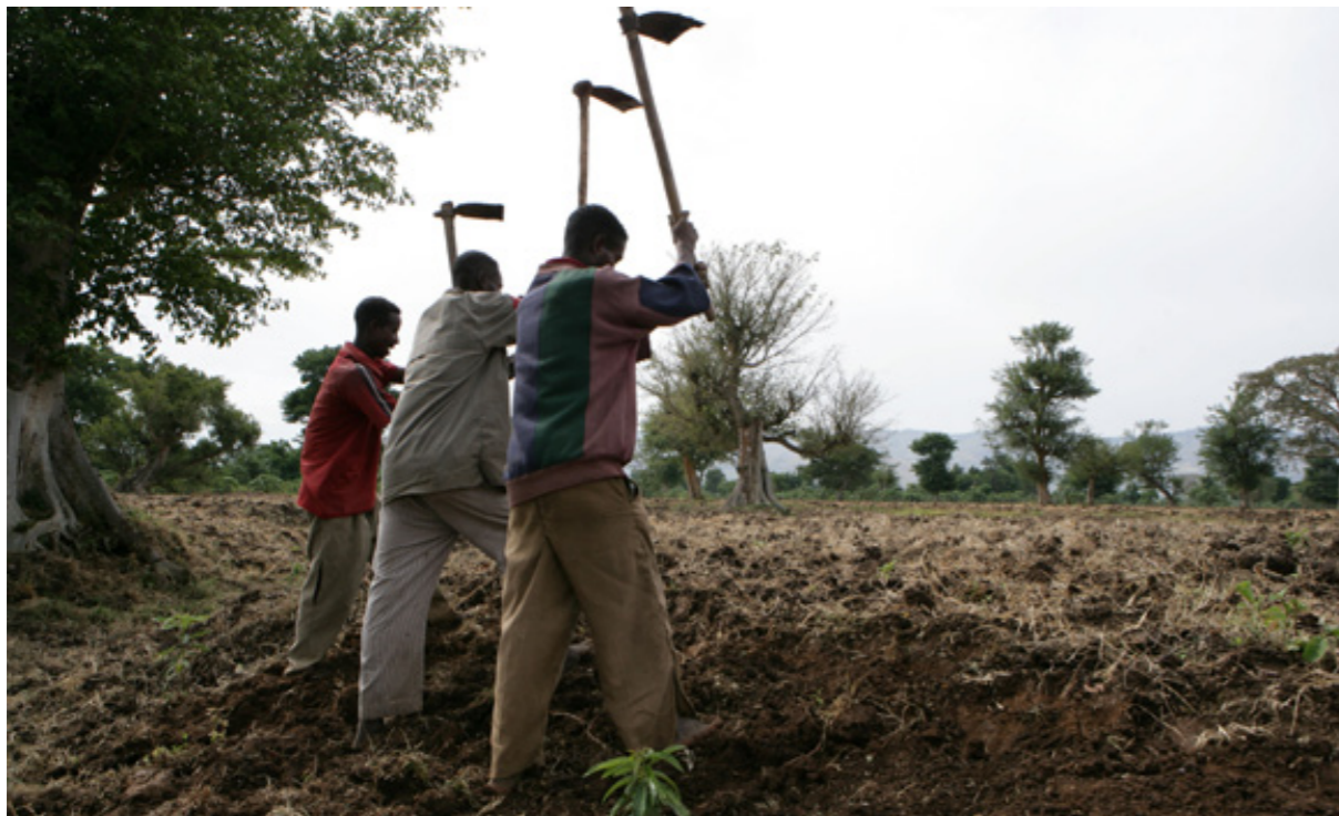
La canya de sucre, la melca dolça, el blat de moro i la iuca es cultiven com aliments a l'Àfrica, però també s'empren per a produir etanol. Foto: Agustí Torres (Etiòpia)

El govern etiòp va seduir a la inversió comunicant que havia signat el Conveni del Centre Internacional d'Arranjament de Diferències Relatives a les Inversions (CIADI), a part de ser membre de l'Organisme Multilateral de Garantia d'Inversions (OMGI) i de l'Organització Mundial de la Propietat Intel·lectual (OMPI). També va fomentar les inversions amb certes garanties fiscals: no exigeix un capital mínim i eximeix als projectes agrícoles estrangers de pagar drets de duana i impostos per la importació de béns de producció. Tampoc hi ha restriccions per emprar personal estranger o repatriar els guanys.