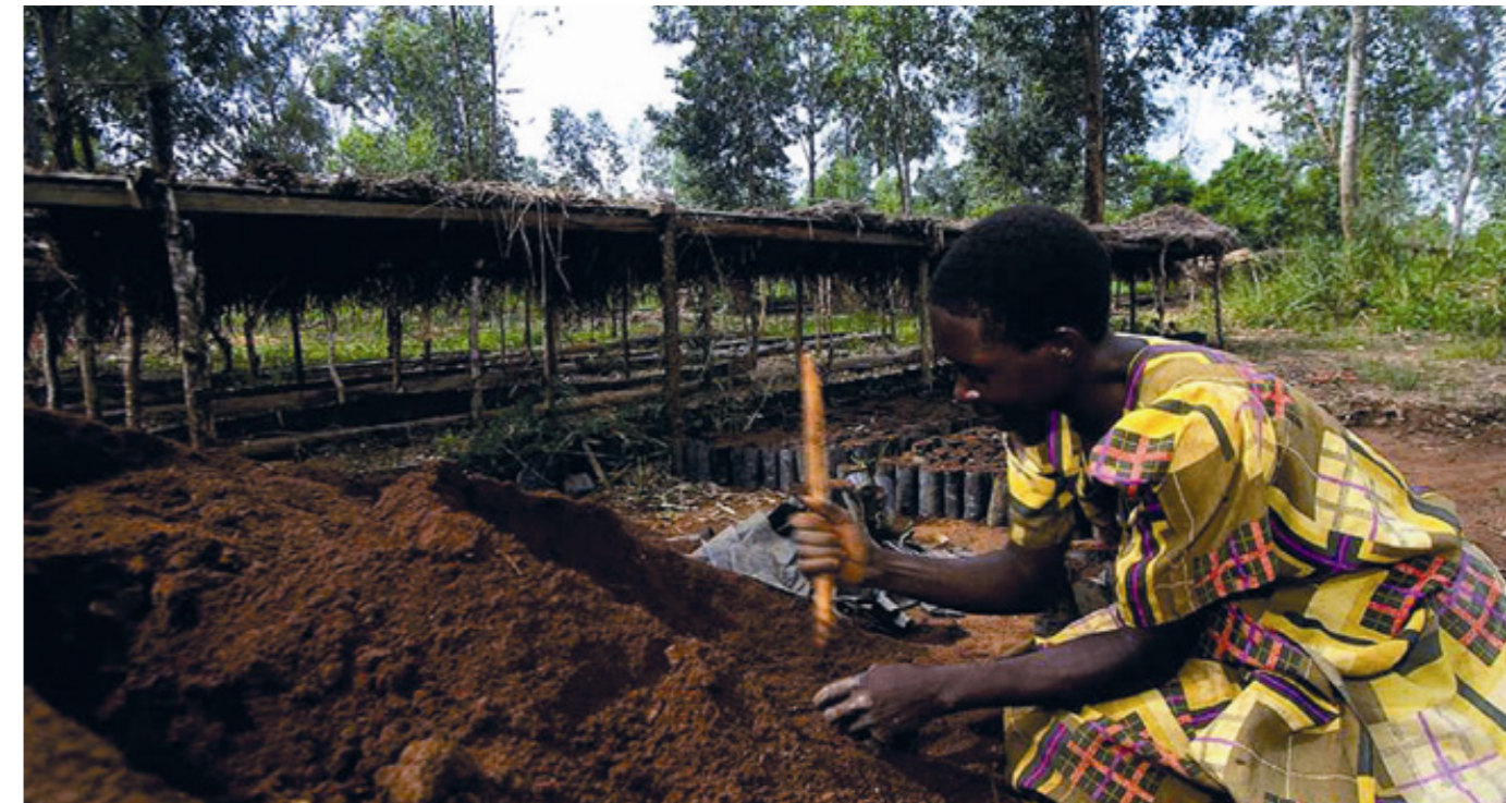
Milers de persones a Uganda denuncien haver perdut les seves terres i el deteriorament que han patit les seves vides com a resultat dels desnonaments.

Segons GRAN, 4.000 hectàrees d'Uganda han estat proporcionades a inversors xinesos per a diferents cultius. Kuwait té previst invertir 100 milions de dòlars per fomentar l'agronegoci i Aràbia Saudita estaria buscant socis comercials per plantar arròs a Uganda i Sudan 57 . Segons aquesta organització, "a Uganda va esclatar una enorme protesta pública quan Reuters va informar de les converses del govern amb el ministeri d'Agricultura d'Egipte, donant detalls d'un arrendament de més de 840.000 hectàrees de terres agrícoles ugandeses (2,2% de la superfície total d'Uganda!) a empreses egípcies per produir blat i blat de moro amb destinació al Caire" 58 . Per la seva magnitud, i les conseqüències que implicaria, aquest projecte manté un enorme secretisme, encara que tot fa sospitar que avança entre bastidors.