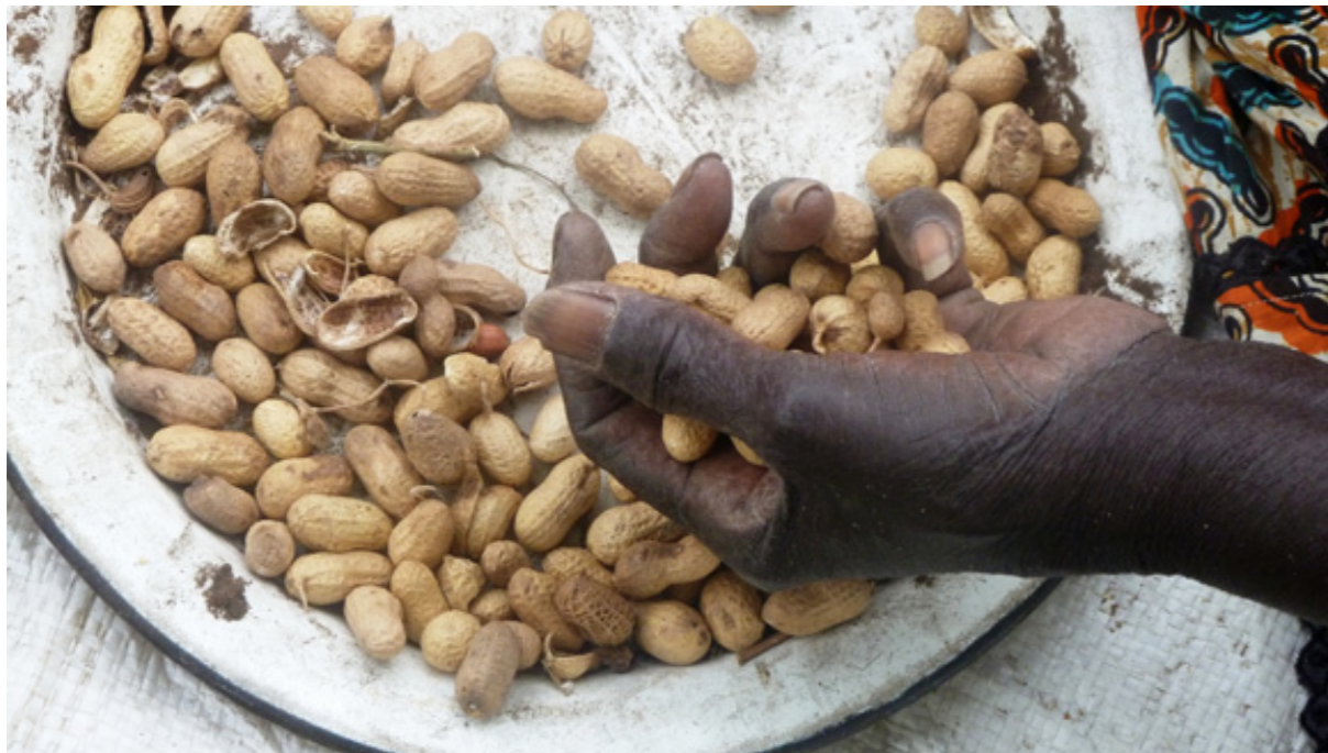
L'accés a la terra a l'Àfrica és més peremptori que mai. (Senegal)

Ara fa cent anys, els camperols d'un país llatinoamericà, Mèxic, es van rebel·lar sota els lemes "la terra per qui la treballa" i "terra i llibertat". En aquestes últimes dècades hem vist empalidir a tot el món les reivindicacions de reformes agràries que corregissin les mala distribució de la terra, l'injust repartiment de la terra que encara persisteix en nacions i continents. Avui, la necessitat de les reformes agràries continua d'actualitat: a l'Amèrica Central, a l'Amèrica andina, a l'immens Brasil, a molts països d'Àsia, a l'Àfrica i, fins i tot, per què no, a països europeus.