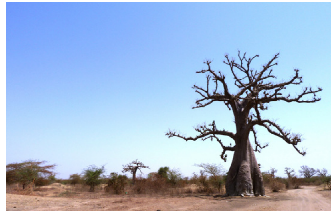
Les planes de Somàlia i Djibouti pateixen una aridesa extrema i sequeres freqüents.

A Etiòpia , fa deu anys que els inversors estrangers van començar a fixar-se en les seves terres fèrtils i, per això, el govern va emprendre una sèrie de reformes radicals que van afavorir la inversió estrangera. De 135 milions de dòlars el 2000 es va passar a 3.500 milions d'inversió agrícola